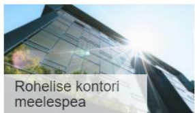
Rohelise kontori meelespea

Seea, hea kolleeg, pakub rubriik Rohenurok sulle võimalust uurida, õppida, meelde tuletada ja avastada. Koos ja kestmalt!